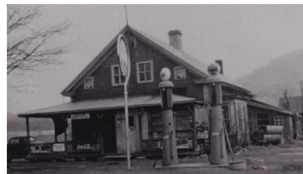
Lane General Store, ca 1940

South Bolton, vers 1940. Le commerce est à la fois bureau de poste, magasin général, station d'essence. En fait, c'est un lieu d'échanges et de rencontres, un centre communautaire.